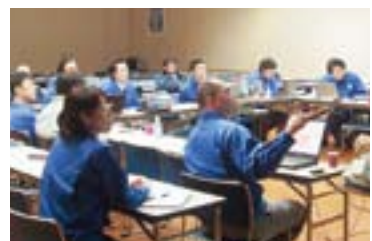
海外各拠点からSGPメンバーが集まり、情報共有をするグローバル会議を開催。