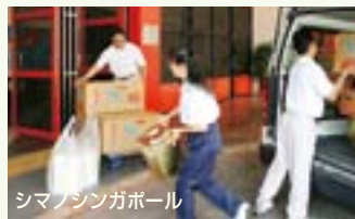
シマノシンガポール