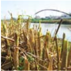
刈り取ることで新芽の成長が促されます。

地域を流れる大和川のヨシ刈りを毎年実施しています。2009年は93人のチームシマノメンバーが参加しました。ヨシは春に芽吹き、水中のリンなどの養分を吸収して成長する間、水をきれいにします。ヨシの水質浄化作用をより効果的なものにするために、冬になって枯れたヨシから