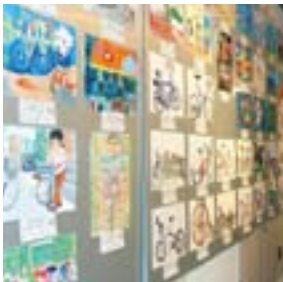
身近な自転車を主題に、子ども達の観察眼や想像力が遺憾なく発揮された作品の数々。

アクセス：JR阪和線「百舌鳥」駅から徒歩10分 〒590-0801 大阪府堺市堺区大仙中町18-2