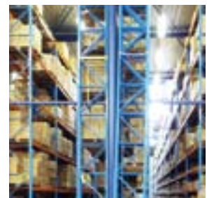
代理店様に一括注文のご協力をしていただき、配送で発生するCO 2 の削減に取り組んでいます。(シマノヨーロッパ)