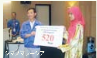
シマノマレーシア