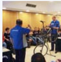
販売店様向けの修理・ メンテナンス講習会(オランダ)