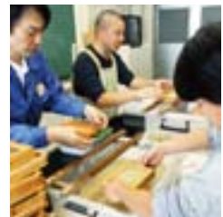
紙漉き体験では、ヨシのはがき をつくりました。