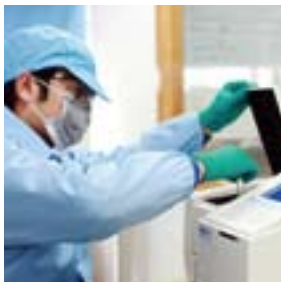
品質管理メンバーが、シマノ製品に禁止物質が使用されていないかをチェック。(シマノクンシャン)

これまで、シマノグリーンプラン(以下SGP)は、順守することで全世界に向けて安心して販売できるよう、常に法規制の動向を監視し、最低限の要求にシマノ自主基準を付加する形で管理してきました。しかし、年々変化する規制や、急速に高まる市場の関心・要求は、SGPより厳しいものとなっています。