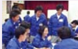
チームで行動する大切さを学ぶ チームビルディング