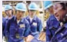
シマノの基盤である、ものづくりの 現場を見学