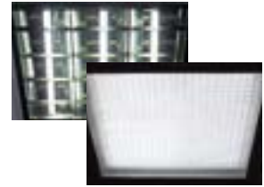
オフィスだけでなく、工場のラインにもLEDライトを導入。(シマノクンシャン)