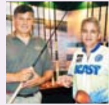
ベスト海水ロッド賞 「Pro Green 882S」