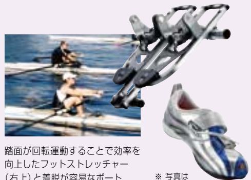
踏面が回転運動することで効率を向上したフットストレッチャー(右上)と着脱が容易なボート競技用シューズ(右下)

自転車や釣りの世界で培った技術を生かし、ロウイング(ボート競技)の世界に漕ぎ出しました。「SRD」とは、自転車ペダルにビンディングシステムを採用し、快適性とペダリング効率を高めた「SPD」(シマノ・ペダリング・ダイナミクス)の技術をロウイング専用に応用した製品です。