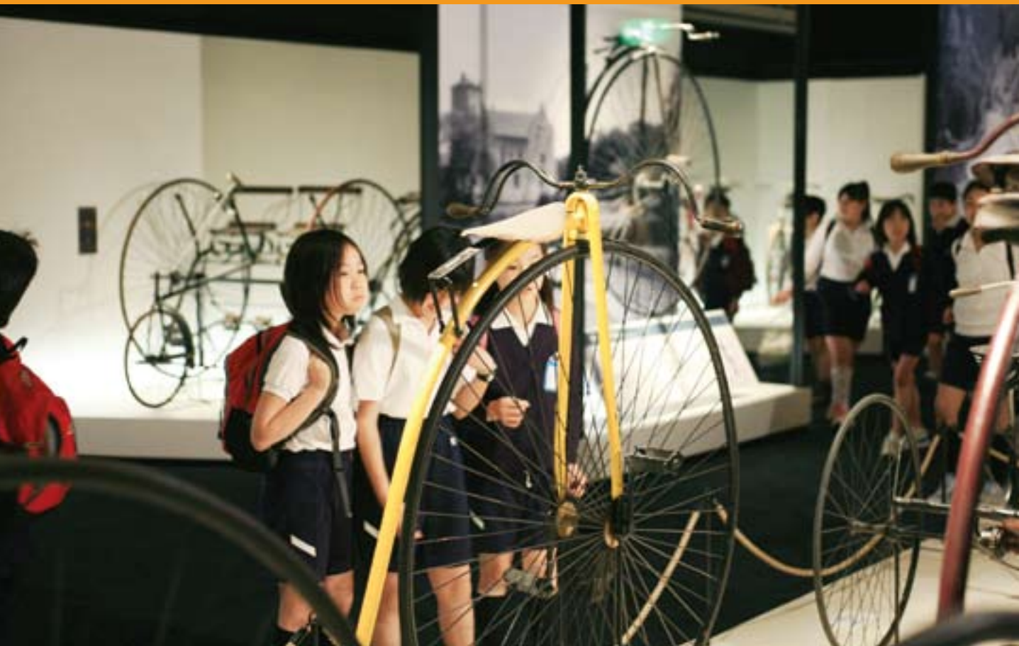
自転車博物館 サイクルセンター

こころ躍る製品をお届けし、健康とよろこびに貢献することはチームシマノが掲げる会社の使命のひとつです。自転車・釣りの楽しさを広げるイベントの開催。プロレーサー・トッププレイヤーのパフォーマンスを観る機会や、新たに挑戦を始める方々が参加していただくための機会の提供。これら様々な取り組みを、グローバルに展開しています。