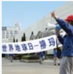
アース・デー活動(中国)