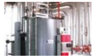
軽油の消費量を抑える高効率ボイラーと凝縮水のリサイクル機器を導入。(シマノクンシャン)