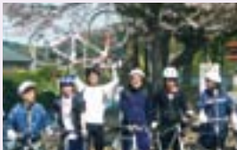
シマノ製品が生み出す楽しみを知る 機会としての自転車実走・釣り体験