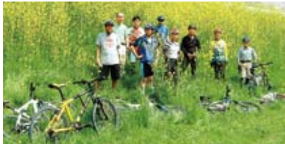
初心者から上級者まで楽しめる機会を提供しています。