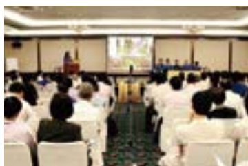
禁止物質の追加など改訂結果を、生産現場や、協力会社の皆様に周知徹底を図る説明会を開催。(シマノシンガポール)

これからも安心してお使いいただける製品を提供できるように、SGPの管理を継続しながら、シマノ製品を支える協力会社の皆様と共にレベルアップのための取り組みを続けて参ります。