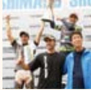
シマノショートトラック