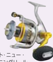
ベスト・ニュー・ スピニングリール 「STELLA SW」

ヨーロッパの釣具見本市「EFTTEX」でも、3年連続で「ベスト・ニュー・スピニングリール」の栄冠をいただきました。