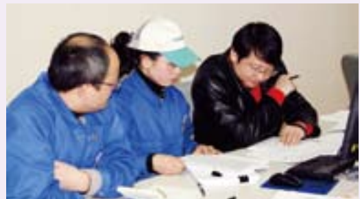
主要拠点それぞれの担当者が報告書の作成に取り組みました (写真はシマノクンシャン)

評価に先立って、世界各地の主要拠点からメンバーを集めたグローバルミーティングを開催しました。進捗状況報告、評価スケジュールの調整などを行うとともに、シマノの体制に適した評価をセッティングし、滞りなく評価を実施することができました。2年に及ぶ周到な準備をして臨んだ結果、大きな不備もなく2010年3月には、内部統制が有効である旨の報告書を提出できる見通しです。