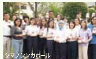
シマノシンガポール

福祉団体 Loving Heart Multi Service Centerが行っている募金活動に協力し、20の部署に募金箱を設置しました。