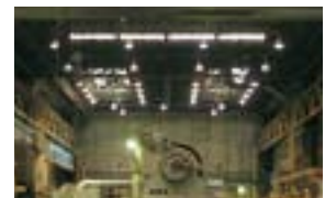
水銀灯の反射板を改善し、照明効率を向上。(シマノ下関)