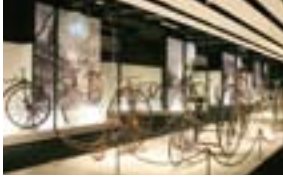
自転車の発展史を学べる2階展示場。

シマノ本社と同じ堺市に、1992年に開館した自転車博物館 サイクルセンター(運営:財団法人シマノ・サイクル開発センター)。博物館を自転車の展示場所にとどめず、自転車のあるライフスタイル、実際に楽しむためのノウハウなどを提案・発信する拠点と位置づけ、様々な活動を行っています。