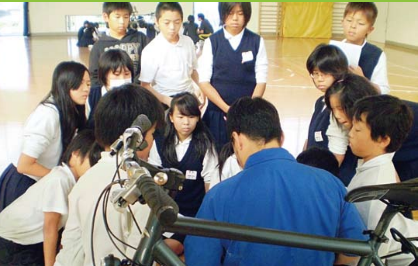
チームシマノメンバーが講師として協力するキャリア教育(日本)

地域社会とのコミュニケーションを行い、 共存・共栄を考えて行動することは、チームシマノが 企業市民として求める姿。 拠点を置く地域社会の一員として、 地域に恩返しする取り組みを積極的に行っています。