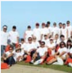
ビーチ・クリーンナップ(アメリカ)