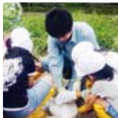
ヨシ苗の植え付け。

地元の小学校の子ども達への環境教育に協力しています。学校近隣の河川にヨシの苗を植え付け、水質浄化効果を確認、刈り取り、そのヨシで紙を漉く。一連の体験を通じて、環境意識の醸成を手助けしています。