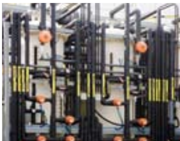
液状廃棄物の有害物質を取り除く特別な処理に取り組んだことで2004年からの5年間「Green Company」として昆山市環境局から表彰を受けました。(シマノクンシャン)

チームシマノメンバーおよび近隣住民の皆様のために、環境への影響を抑える対策にも取り組んでいます。