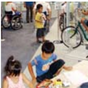
コンクール募集期間中は、写生目的の入館を無料にしています。館内には写生台も設置。