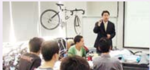
シマノ上海での新入社員研修

通年採用を行っている海外拠点では、新たに加わったメンバーに対して、シマノの歴史や、企業理念を理解してもらう新入社員研修を行っています。チームシマノのメンバーは全世界で共通の理念のもと、考え、行動します。