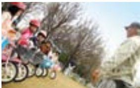
自転車乗り方教室 自転車が初めての方でも、1日で乗れるように丁寧に指導しています。