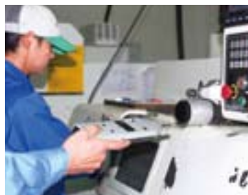
工場の騒音をモニターするシステムを確立し騒音対策に取り組んでいます。(シマノクンシャン)