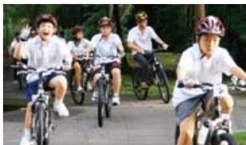
STAMP (スポーツ教育指導プログラム)への協力(シンガポール)

地域社会とのコミュニケーションを行い、 共存・共栄を考えて行動することは、チームシマノが 企業市民として求める姿。 拠点を置く地域社会の一員として、 地域に恩返しする取り組みを積極的に行っています。