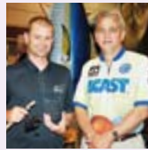
ベスト淡水リール賞 「Stradic C14」

アメリカの業者様・販売店様向け釣具展示会「ICAST」においてシマノのリールとロッドが8年連続の受賞をはたしました。