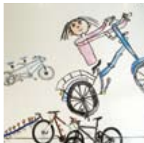
3階展示場には、過去の応募作品を壁一面にあしらっています。