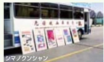
シマノクンシャン