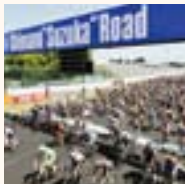
シマノ鈴鹿ロードレース