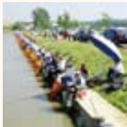
中国瀋陽シマノ仙風杯