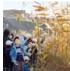
子ども達の背丈より成長し、 枯れたヨシを刈り取り。